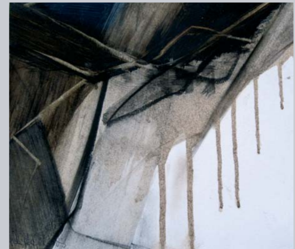
Giallo < Blu