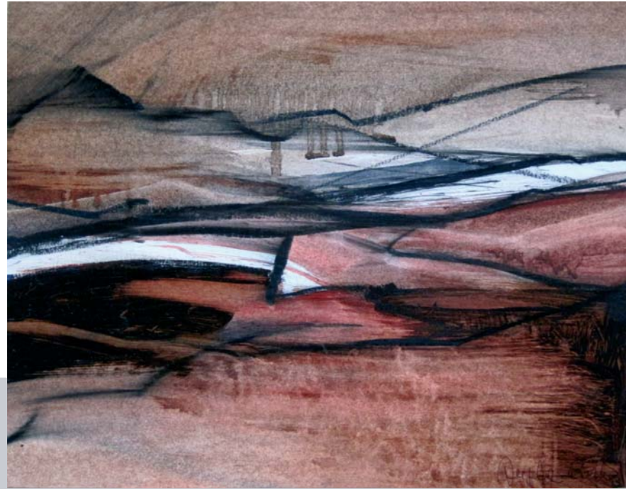
Arancio > Verde